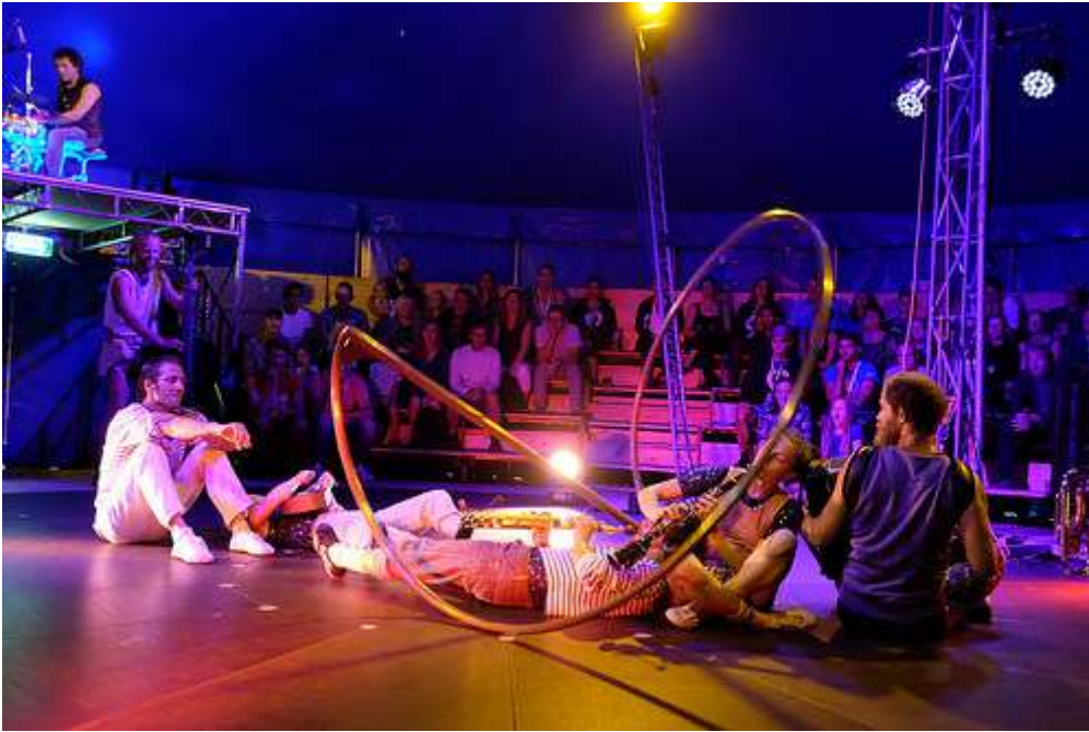
Matematisk omfamning. Spiralhjulet är det enda cirkusredskapet i sitt slag.

Åtta svenska-europeiska cirkusartister som också är musiker. Smidigt växlar de uppgifter, numren flyter över i varandra, mycket sker samtidigt. Det är vackert, överraskande och magiskt. Det höga tempot når förstaaktsfinalens höjdpunkt där alla musicerar någonstans i det intima tältet.