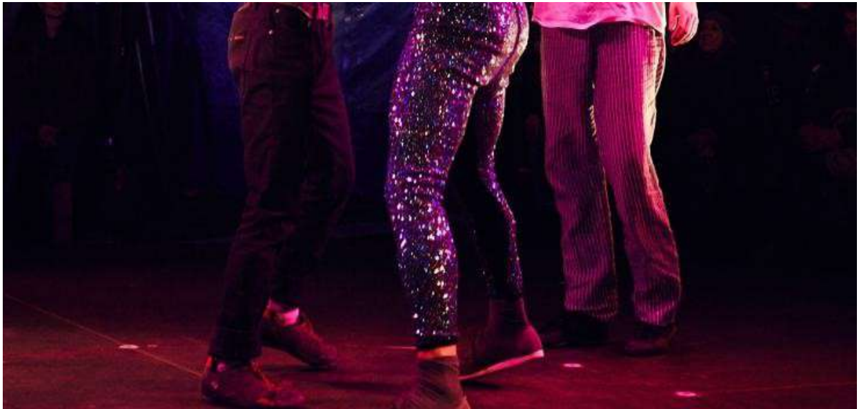
Circus I Love You propose un spectacle éblouissant !

Il est couleur framboise et est installé sur le site de la Poterie, à Hennebont (Morbihan). C'est là que le festival des Ronds dans l'eau accueillera, pour deux représentations, Circus I Love You , un cirque utopiste.