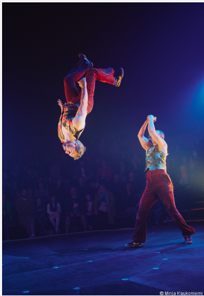
I Love You 2 - Circus I Love You

Biennale Internationale des Arts du Cirque 2023.