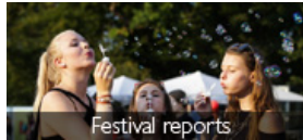
Festival reports ( https://www.concertnews.be/festivalverslag.php?kop=Sziget%202022 )

( https://www.concertnews.be/festivalverslag.php?kop=Sziget%202022 ) ( https://www.concertnews.be/festivalverslag.php?kop=Sziget%202022 )