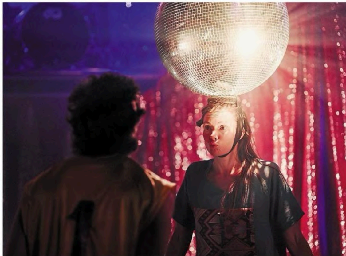
« Fun n°1 », parade à la morosité ambiante !

Pendant 1 h 20, la dizaine d'acrobates-musiciens en plateau — la troupe compte une quinzaine de membres originaires d'un peu partout en Europe — enchaîne les numéros époustouflants, « un peu à la manière du cirque traditionnel, sans être du cir-