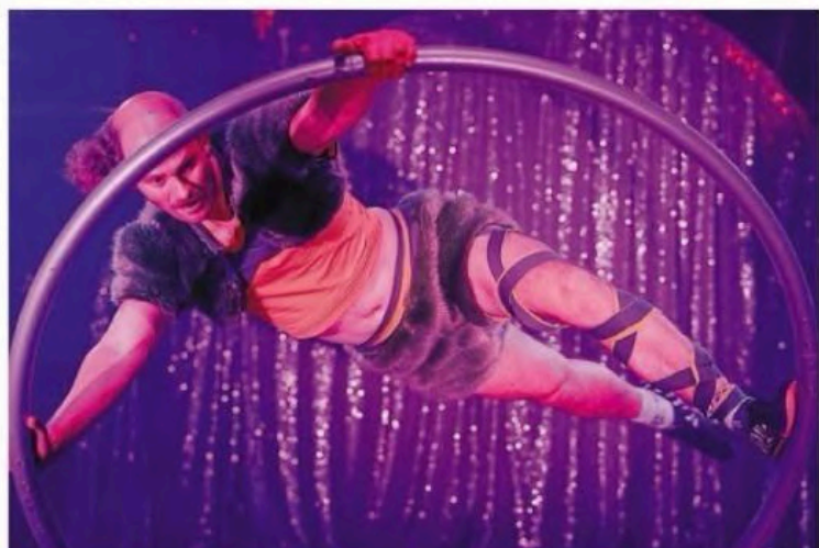
Au programme : des acrobaties, et encore des acrobaties !

Du jeudi 13 au dimanche 23 novembre , place du Café des Images à Hérouville-Saint-Clair. Tarifs : de 8 à 25 €. Horaires détaillés en ligne sur le site lesboreales.com . Réservations sur le site internet de la Comédie de Caen, au théâtre d'Hérouville, au 02 31 46 27 29.